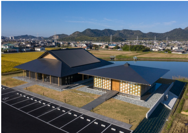
上空からの外観（R3.1号より）

社会が少子高齢化・過疎化へと大きく変化するなか、先祖・亡き人との新しい関係を構築する為の納骨堂、古い本堂を補完し人々が集う門徒会館、寺院のあり方はどうあるべきか問いかけながら設計を進めたとのこと、納骨堂は浄土を体現できる空間とし、門徒会館は現世をイメージする空間としたとお聞きしました。