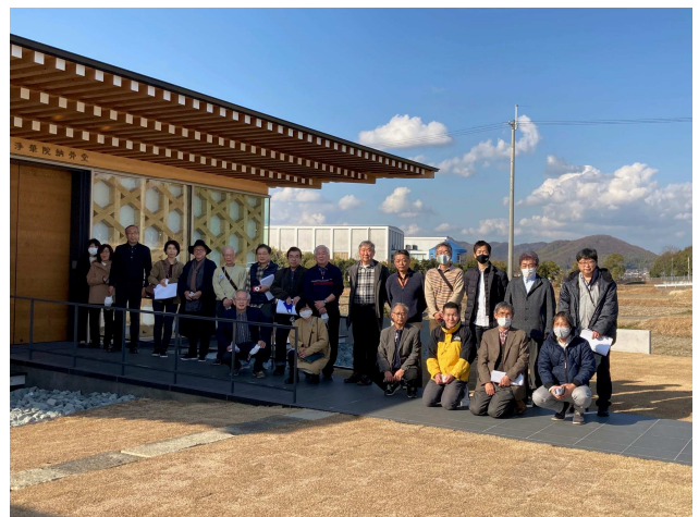
見学会当日集合写真